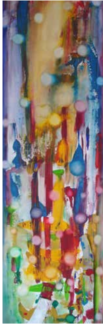
„Lebensfreude“, 100 x 30 cm, Mischtechnik, 2014