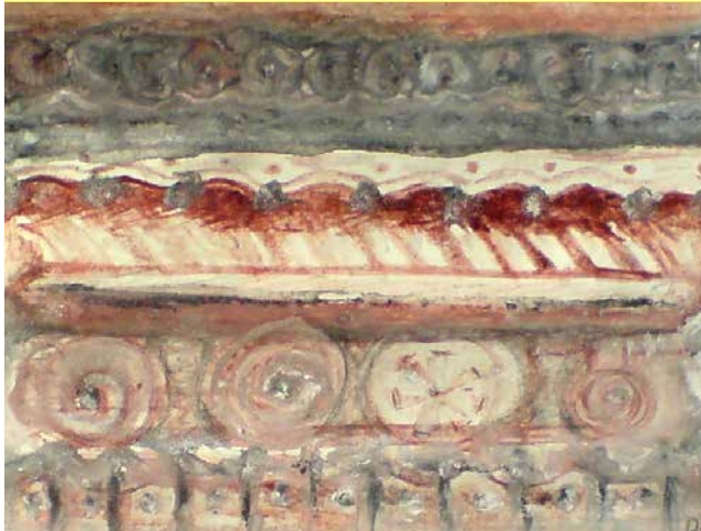
„Something's missing“, 25 x 10 cm, Aquarell, 2015