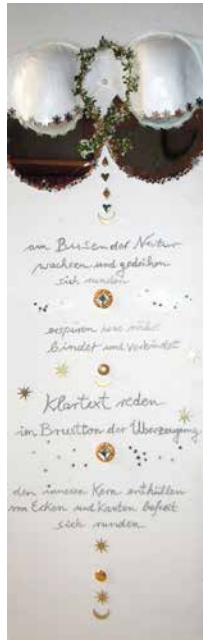
„Von Ecken und Kanten befreit“, 100 x 30 cm, Installation, 2012