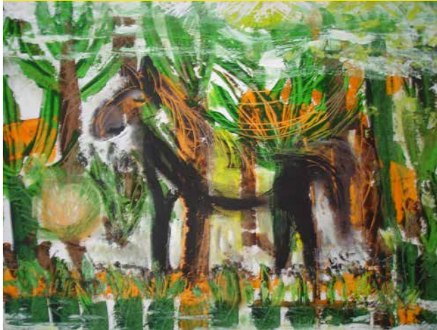
„Paradiesisch“, 65 x 55 cm, Ölfarbe, 2010