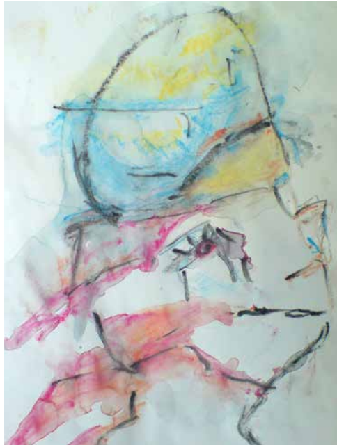
„The Duke’s Head“, 30 x 20 cm, Aquarell, 2015