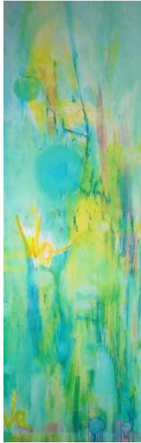
„Wo We“, 100 x 30 cm, Acryl, 2014