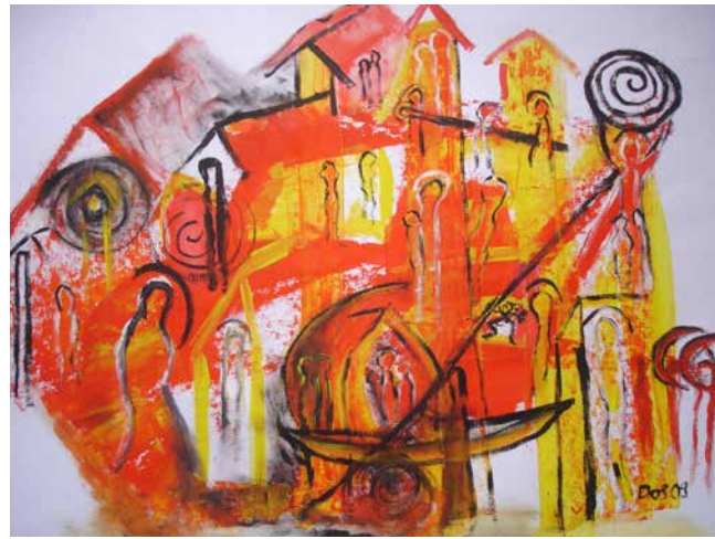
„Übergang IV“, 38 x 54 cm, Ölfarbe, 2009 Manchester Kathedrale, 2016