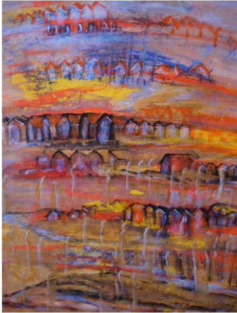
„Im Moment des Sehns“, 60 x 80 cm, Acryl, 2014 Choko-Café, Berlin-Charlottenburg, 2017