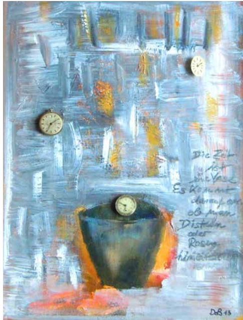
„Die Zeit ist eine Vase“, 45 x 36 cm, Mischtechnik, 2014 Schwarzes Café, Berlin-Charlottenburg, 2017