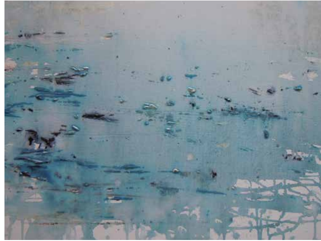
„Blickwechsel Nr. 11“, 40 x 60 cm, Acryl, 2015 Berlin-Charlottenburg, 2017