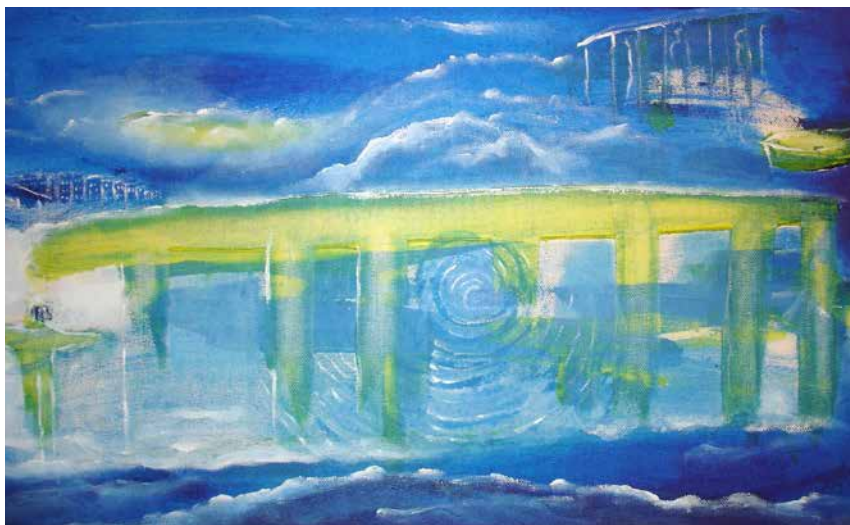
„Aus der Stille Nr. 9“, 30 x 60 cm, Acryl, 2013 Bildwechsel in Berlin, 2015