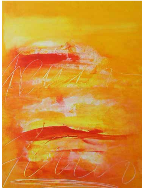
„Kunstfeuer“, 70 x 50 cm, Mischtechnik, 2014 Pub in Earl's Court, London, 2015/16