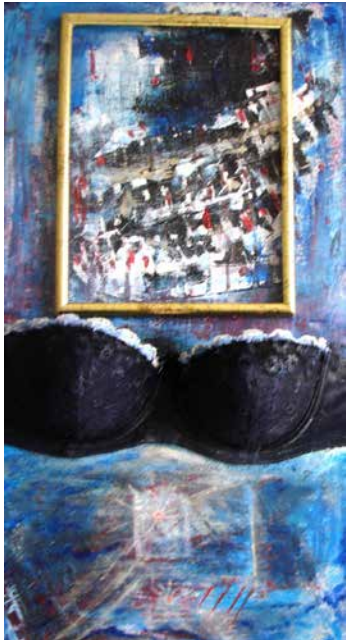
„Ausgehängt II“, 60 x 30 cm, Installation, 2012 Schwarzes Café, Berlin-Charlottenburg, 2017