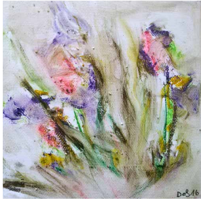
„Wenn der Himmel in Blüten fällt Nr. 3“, 15 x 15 cm, Mischtechnik, 2016 Berlin-Dahlem, 2017