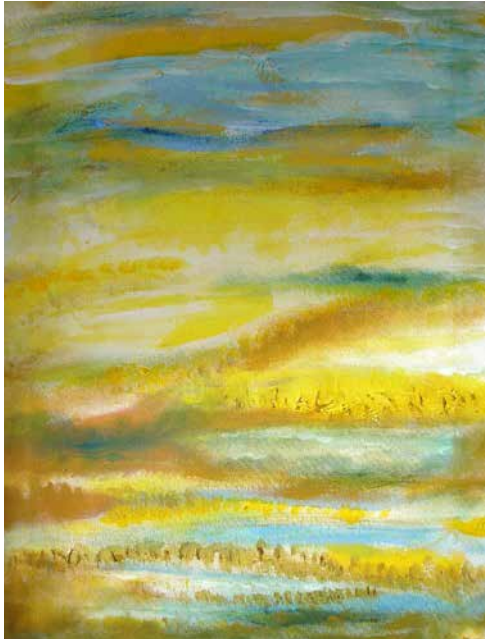
„Aus der Stille Nr. 2“, 60 x 40 cm, Acryl, 2014 Pub in Earl's Court, London, 2015/16