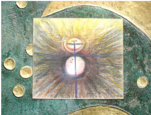
„Metamorphose VI“, 20 x 20 cm, Mischtechnik, 2008