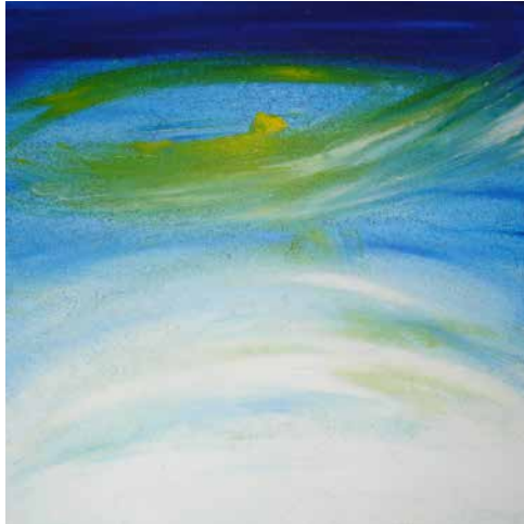
„Flügelschlag“, 40 x 40 cm, Acryl mit schwarzer Lava, 2010