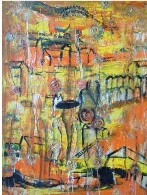
„My house is my castle“, 53 x 43 cm, Acryl, 2014