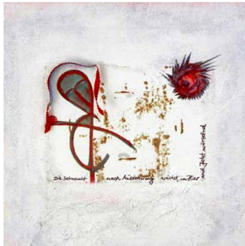
„Veränderungen sehen“, 30 x 30 cm, Mischtechnik, 2013