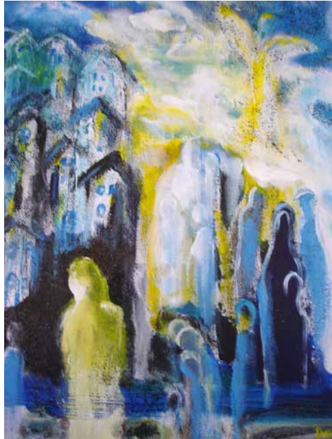
„In einer anderen Welt“, 40 x 30 cm, Acryl, 2010