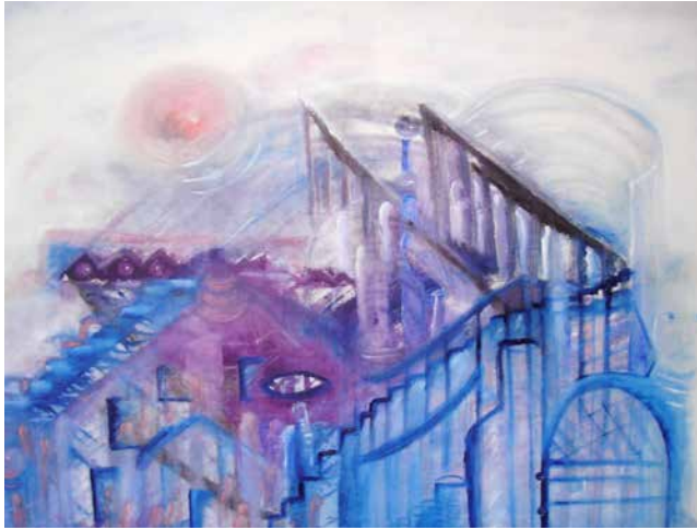
„Verbunden über Raum und Zeit“, 90 x 100 cm, Ölfarbe, 2010