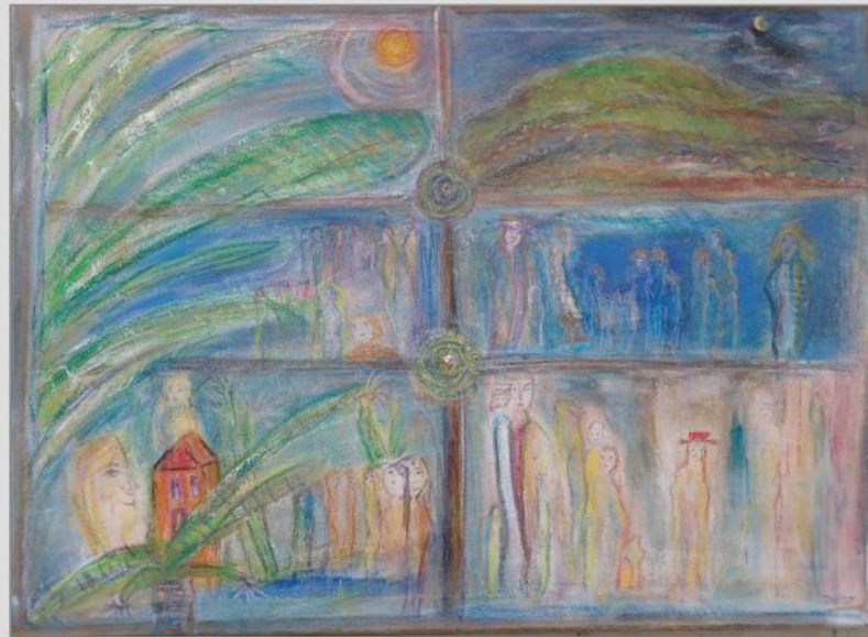
Ein andere Zeit – 2025, Mischtechnik, 50x70cm