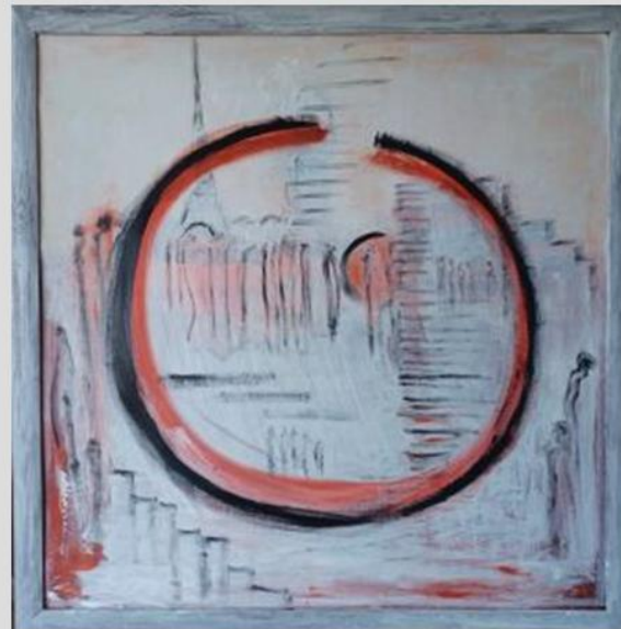
I love Paris – 2024, Mischtechnik, 88x88cm

Bilder von Dorothea Stockmar wechseln den Ort