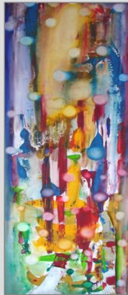
Lebensfreude – 2014, Mischtechnik, 100x88cm