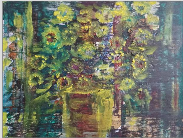
Stilleben 2 – 2024, Acryl, 30x35cm

Bilder von Dorothea Stockmar wechseln den Ort