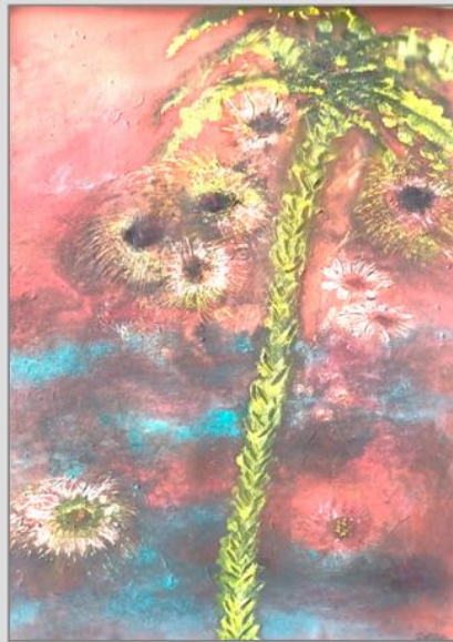
Stilleben 1 – 2024, Acryl, 53x33cm

Bilder von Dorothea Stockmar wechseln den Ort