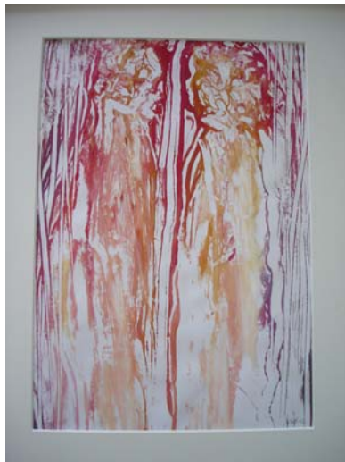
D. Stockmar, „Begegnung“, Mischtechnik, 50x40cm, 2012