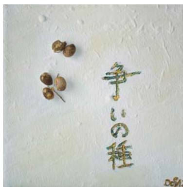
争いの種 / あらそいのたね Anlass zu Streit geben; den Samen für Streit legen D. Stockmar, „Kernproblem“, Mischtechnik auf Leinwand, 20x20cm, 2012