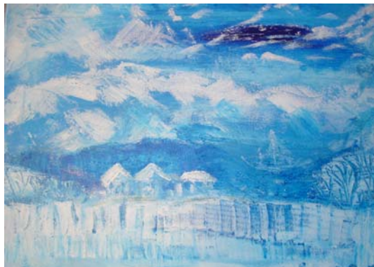
D. Stockmar, „Eismeer“, Acryl auf Leinwand, 30x40cm, 2010