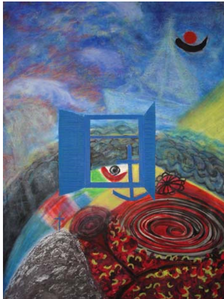
D. Stockmar, „Wolkenschiff“, Druck, 60x40cm, 2008