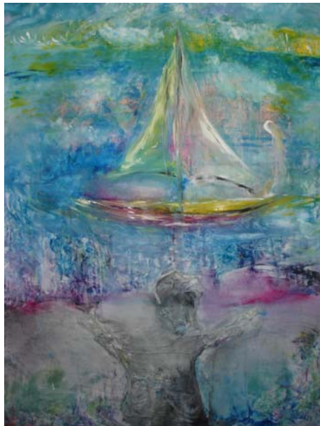
D. Stockmar, „verträumt“, Acryl, 100x70cm, 2010