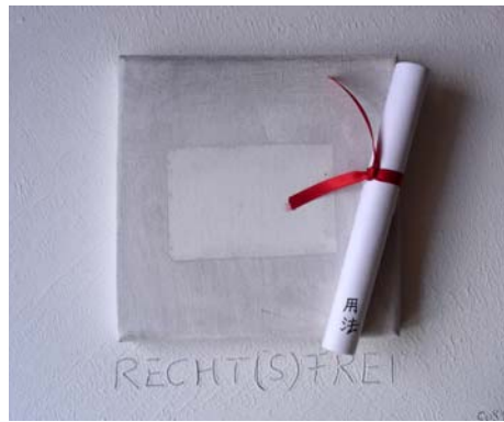
用法 / ようほう (Art und Weise der Benutzung) D. Stockmar, „recht(s)frei“, Mischtechnik auf Leinwand, 24x30cm, 2012