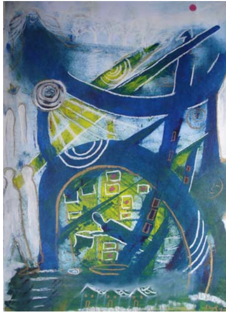
D. Stockmar, „aufwärts/abwärts“, Ölfarbe, 43x30cm, 2011