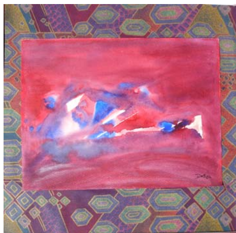
D. Stockmar, „Kaleidoskop“, Mischtechnik, 40x60cm, 2007