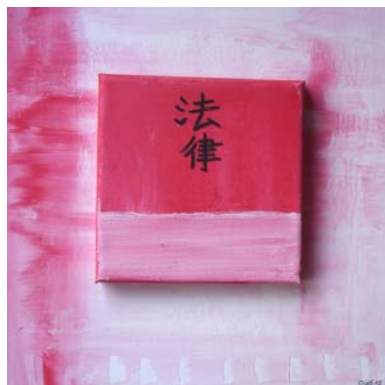
法律 / ほうりつ (Gesetz, Recht) D. Stockmar, „im Zeichen des Gesetzes“, Mischtechnik auf Leinwand, 30x30cm, 2012