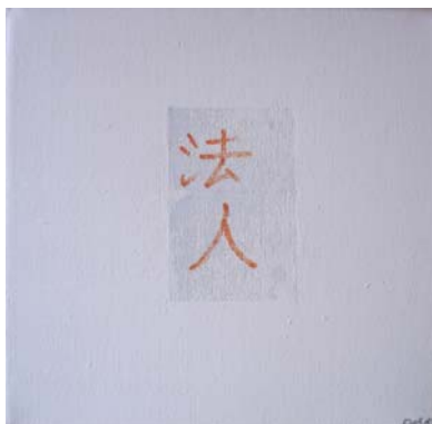
法人 / ほうじん ( juristische Person; Körperschaft des öffentlichen Rechts ) D. Stockmar, „juristische Person“, Mischtechnik auf Leinwand, 20x20cm, 2012

DOROTHEA STOCKMAR RECHT – NAH – RECHT – BUNT 2012