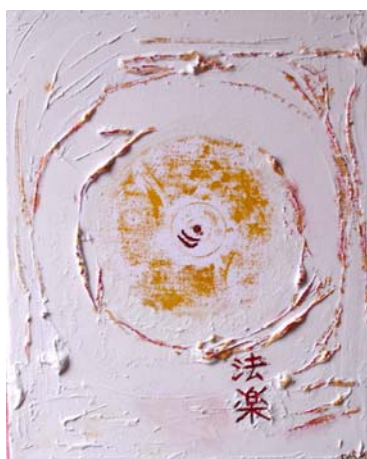
法楽 / ほうらく ( Gesetz u. Musik ) [1] Musik zu buddh. Messe oder Shintō-Ritus. [2] {Buddh.} Freude an guten Taten. [3] (ugs.) Vergnügung; Unterhaltung; Erheiterung. D. Stockmar, „HORAKU“, Mischtechnik auf Leinwand, 30x24cm, 2012