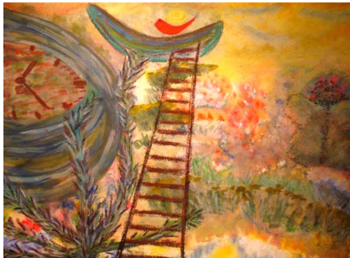
D. Stockmar, „Werden und Vergehen“, Acryl, 50x70 cm, 2007