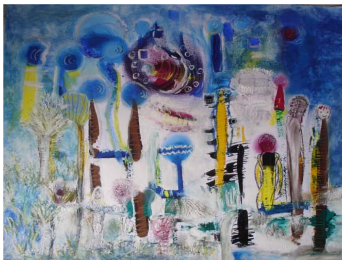
D. Stockmar, „am Ende“, Mischtechnik, 50x70cm, 2011