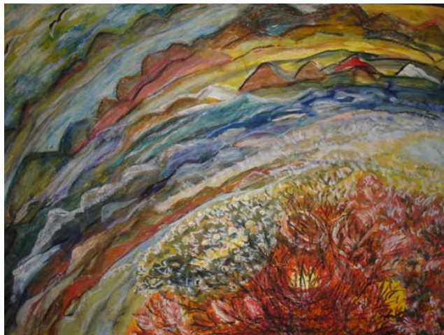
D. Stockmar, „jenseits der Berge“, Mischtechnik, 50x70cm, 2007