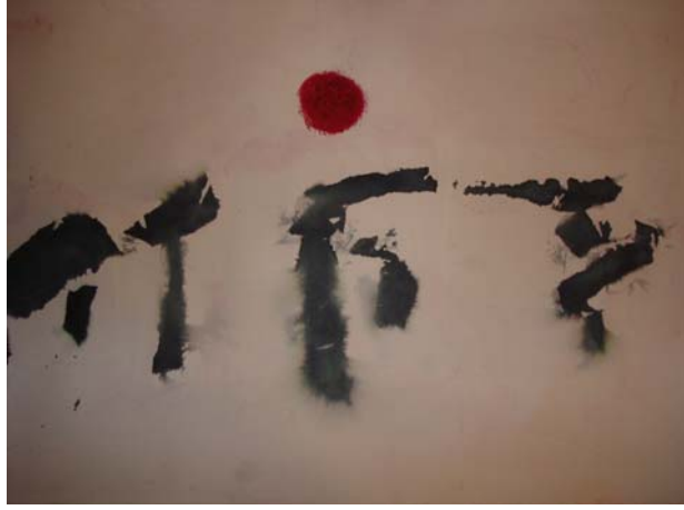
D. Stockmar, „der Weg“, Mischtechnik, 50x53cm, 2009