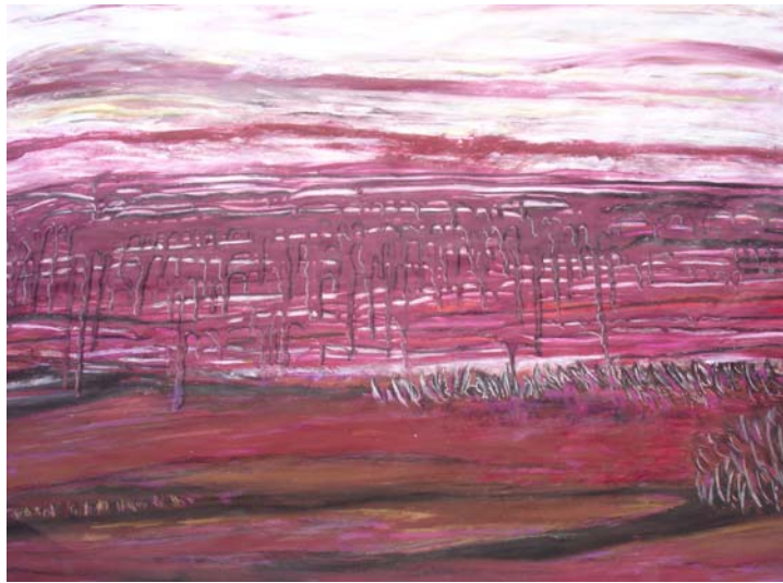
D. Stockmar, „Verläufe“, Mischtechnik, 70x100 cm, 2008